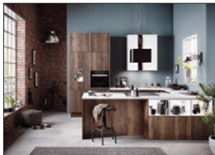
Kunststoff (Bali, Boston, Comet, Meteor, Neo, Toronto, Uno, Vancouver)

Melaminfronten mit beidseitig dekorativer Kunststoffbeschichtung und allseitig Kunststoff-Formkante. DIN 68765 Kunststoffbeschichtete dekorative Flachpressplatten.