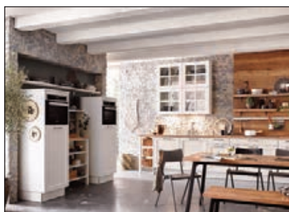
Kunststoff ummantelt (Lotus, Breda, Malaga, Integrale)

Die Pflegesets und Ausbesserungsmaterialien finden Sie im Kapitel Einzelteile: Reinigungs- und Pflegeset 2: PS19.08 Ausbesserungsmaterial: Wachskitt (WK19.97), Ventilstift (VS19.99)