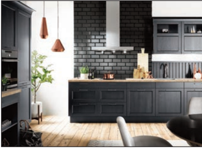
Esche lackiert (Bristol)