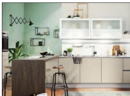
Lacklaminat (Laser Soft, Laser Brillant)

Die Pflegesets und Ausbesserungsmaterialien finden Sie im Kapitel Einzelteile: Reinigungs- und Pflegeset 2 (Bali, Boston, Comet, Meteor, Neo, Toronto, Uno, Vancouver): PS19.08 Ausbesserungsmaterial: Wachskitt (WK19.97), Ventilstift (VS19.99)