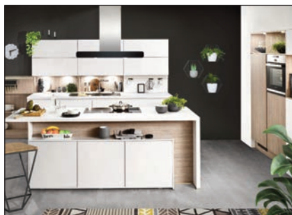
Hochglanz lackiert (Faro, Lumos)

Die Pflegesets und Ausbesserungsmaterialien finden Sie im Kapitel Einzelteile: Reinigungs- und Pflegeset 1 (Laser Soft): PS19.07 Reinigungs- und Pflegeset 2 (Laser Brillant): PS19.08 Ausbesserungsmaterial: Wachskitt (WK19.97), Ventilstift (VS19.99)