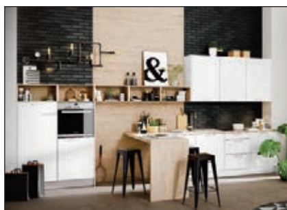
Hochglanz lackiert (Cristall)

Die Pflegesets und Ausbesserungsmaterialien finden Sie im Kapitel Einzelteile: Reinigungs- und Pflegeset 2: PS19.08 Ausbesserungsmaterial: Wachskitt (WK19.97), Ventilstift (VS19.99)